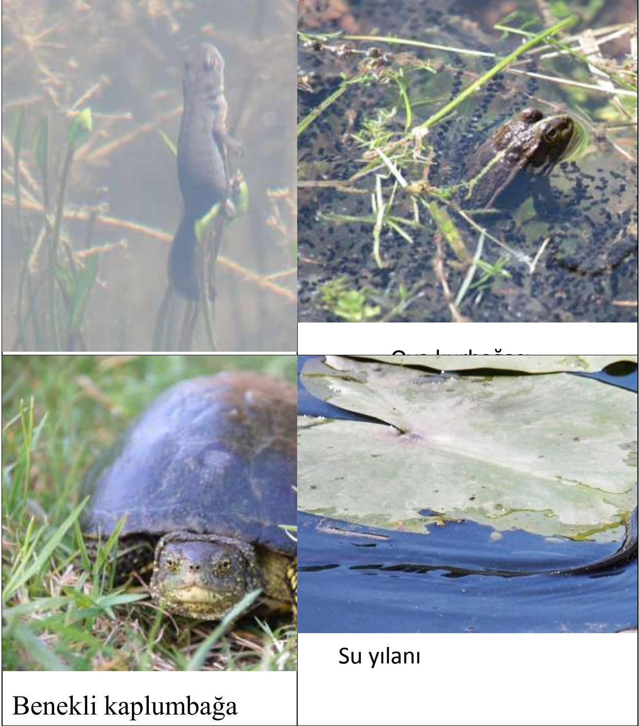
Şekil 2. Bazı herpetofauna türlerine ait resimler